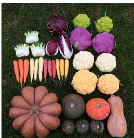
La varietà dei colori delle orticole coltivate in campo a Sant'Apollinare (Rovigo)